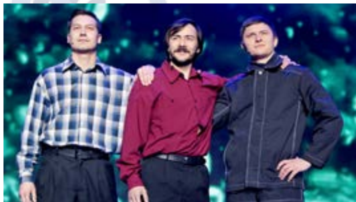
Фрагмент спектакля «Простое счастье» по воспоминаниям первопроходцев

К очному этапу конкурса экспертами были допущены 96 проектов на актуальные темы в области профессиональной подготовки молодых специалистов, охраны окружающей среды, культурно-досуговой деятельности, патриотизма, социальной поддержки и научно-технического творчества молодежи. Во второй тур прошли 68 проектов, 14 из них будут защищать представители молодежных комитетов ООО «Газпром трансгаз Югорск»!