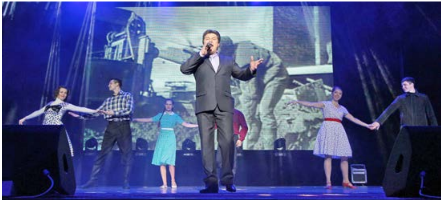
Торжественное открытие Международного молодежного форума состоялось в киноконцертном зале Центра культуры «Югра-презент»

Вновь газотранспортная столица Югры и градообразующее предприятие «Газпром трансгаз Югорск» гостеприимно распахнули свои двери перед участниками Международного конкурса среди организаций на лучшую систему работы с молодежью. Все они - инициативные и небезразличные парни и девушки – в очередной прибыли к нам самых из разных уголков нашей страны и Республики Беларусь, чтобы повидать старых и обрести новых друзей и, это главное, представить и защитить 68 актуальных, действенных проектов и идей. Чтобы тем самым внести реальный вклад в развитие производства, социальной сферы регионов и всем вместе сделать еще один шаг на пути к процветанию нашей Родины.