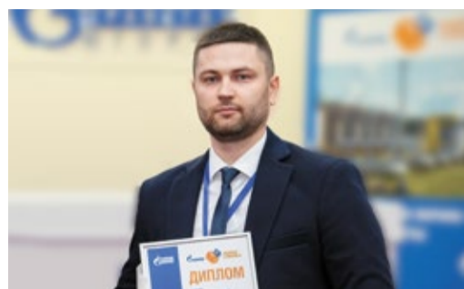
Я ВЫБИРАЮ БЕЗОПАСНОСТЬ Интервью с победителем конкурса на лучшего уполномоченного по охране труда стр. 7