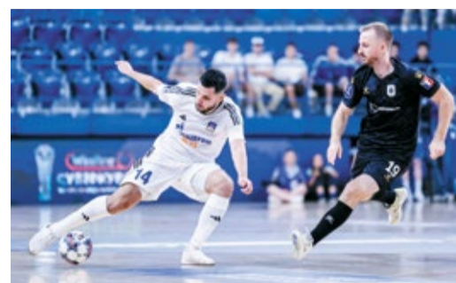
МФК «ГАЗПРОМ-ЮГРА» - ОБЛАДАТЕЛЬ СУПЕРКУБКА РОССИИ стр. 8