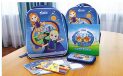
ПЕРВЫЙ ПОМОЩНИК ПЕРВОКЛАССНИКАМ Благотворительная акция «Портфель первоклассника» стр. 4