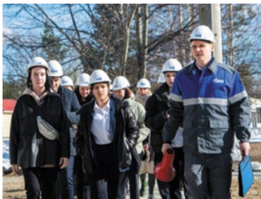
Экскурсия для студентов колледжа

Правильные ли когда-то были приняты решения, может рассудить только вре-