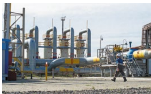
ОТ ПЕРВОГО ГАЗА К 18 ТРИЛЛИОНУ В производственной деятельности компании произошло знаковое событие стр. 3