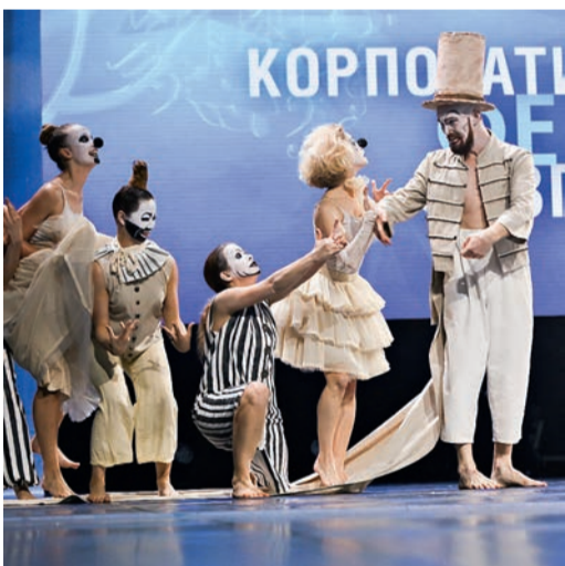
Танцевальный театр «Никогда»

ВСЯ НАША ЖИЗНЬ – ПЕРЕПЛЕТЕНИЕ СУДЕБ, СЛУЧАЙНЫЕ ВСТРЕЧИ, ЗАПОМИНАЮЩИЕСЯ МОМЕНТЫ И УДИВИТЕЛЬНЫЕ ИСТОРИИ, О КОТОРЫХ ЗРИТЕЛЮ РАССКАЗЫВАЮТ ФИНАЛИСТЫ «ФАКЕЛА». ЭМОЦИИ И ПЕРЕЖИВАНИЯ НАШИХ УЧАСТНИКОВ МЫ ЧУВСТВУЕМ ПОСРЕДСТВОМ КАЖДОГО ДВИЖЕНИЯ В ТАНЦЕ, СЛОВА В ПЕСНЕ, ЖЕСТА ИЛИ УЛЫБКИ.