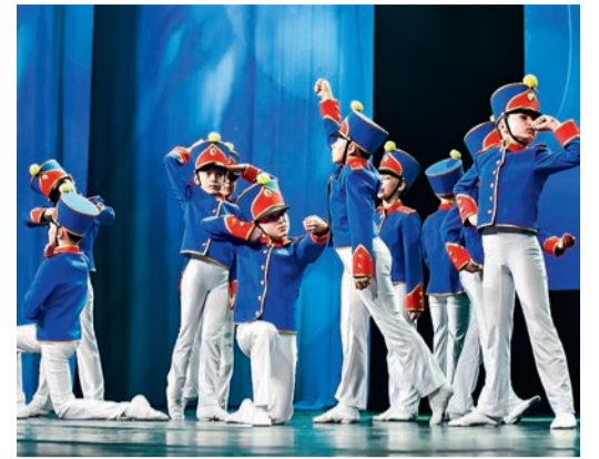
Танцевальный коллектив «Лапушки»

льери (Италия). Вот уже много лет ансамбль является ежегодным участником Всероссийского фестиваля «Шолоховская весна» в станице Вешенской Ростовской области. И, конечно, на всех праздниках и мероприятиях радуется своим творчеством жителей родного хутора Калининский.