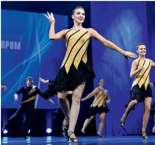
Ансамбль бального танца «Сеньоры»

ЭТИ КОЛЛЕКТИВЫ ВЫСТУПАЛИ ПРАКТИЧЕСКИ НА КАЖДОМ ФЕСТИВАЛЕ «ФАКЕЛ». ИХ НЕ УДИВИТЬ НИ МАСШТАБОМ СЦЕНЫ, НИ СТРОГОЙ ОЦЕНКОЙ ЖЮРИ. НО ВОЛНЕНИЕ ПЕРЕД КАЖДЫМ ВЫХОДОМ ДОКАЗЫВАЕТ, ЧТО ВЫСТУПЛЕНИЕ ИДЕТ ОТ СЕРДЦА И ДУШИ.