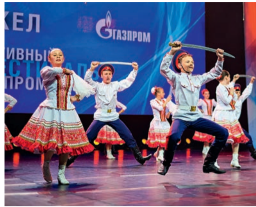
Детский фольклорный ансамбль песни и танца «Донской родничок»

«Донской родничок» действительно стал звездным, ведь за плечами – победы во многих фольклорных фестивалях: «Мы – потомки казаков» в Ростове-на-Дону, Фестиваль казачьей культуры в Москве, «Don Kazak» в Ка-