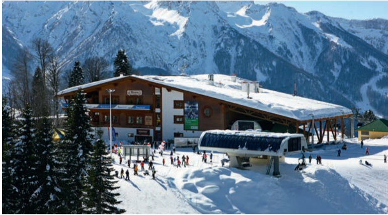
Горный приют «Псахак»

Отдыхать здесь хорошо в любое время. Летом можно подняться в горы, прогуляться по альпийским лугам, заняться скандинавской ходьбой, устроить заезды на квадроциклах или велопрогулку по лесным тропам, красивой набережной, сыграть в теннис или отдохнуть у открытого бассейна. Зимой – покататься на сноуборде, горных или беговых лыжах, устроить веселые заезды на сноутюбингах и настоящие гонки на высокогорном картинге, проехать на собачьих упряжках и пройти на снегоступах к белоснежным вершинам. Особой популярностью у гостей пользуется экскурсионный маршрут на самой длинной в мире канатной дороге типа «3S».