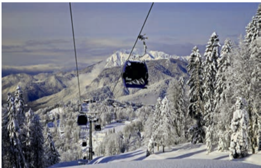
Горно-туристический центр «Газпром»