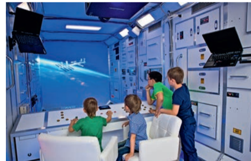
Научно-познавательный центр «Космодром»