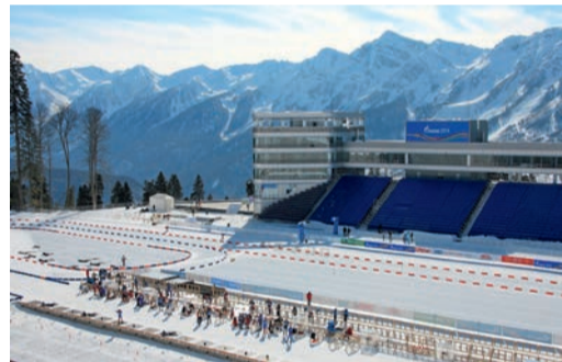
Лыжно-биатлонный комплекс «Лаура»