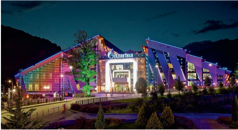
Развлекательный центр «Галактика»

ГОРНО-ТУРИСТИЧЕСКИЙ ЦЕНТР «ГАЗПРОМ» – ВСЕСЕЗОННЫЙ СЕМЕЙНЫЙ КУРОРТ, РАСПОЛОЖЕННЫЙ В КРАСНОЙ ПОЛЯНЕ. ОБЩАЯ ПЛОЩАДЬ КУРОРТА СОСТАВЛЯЕТ 373 ГЕКТАРА.