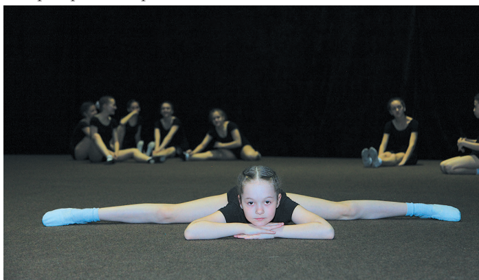
Ансамбль «Лапушки» ООО «Газпром трансгаз Югорск»