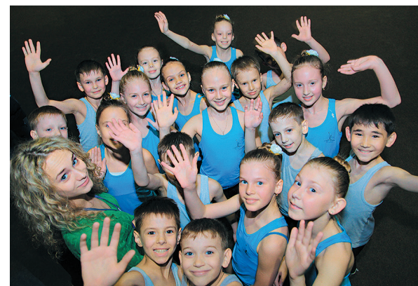
Ансамбль «Веснушки» ООО «Газпром трансгаз Томск»