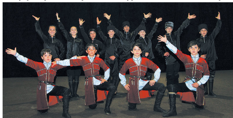
Ансамбль «Сари Кум» ООО «Газпром трансгаз Махачкала»

С утра первого дня финального тура «Факела» в зале Конгресс-центра проходят репетиции.