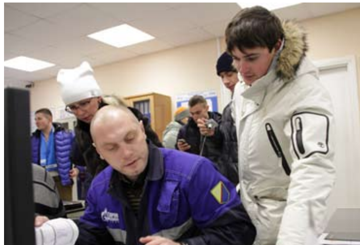
Работникам газокompрессорной службы пришлось ответить на многочисленные вопросы гостей

Затем экскурсовод провел всех в машинный зал одного из компрессорных цехов, где подробно рассказал о процессе приемки и транспортировки газа, о задачах, с которыми справляется обслуживающий персонал – машинисты ТК, слесари КИПиА, инженеры. Для многих гостей стало удивительным то, что этим сложнейшим цеховым оборудованием и технологическими газопроводами управляет небольшой коллектив. И поэтому работникам газокompрессорной службы при-