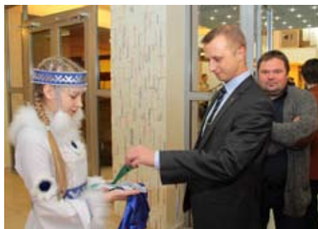
На входе молодежь приветствовали волонтеры