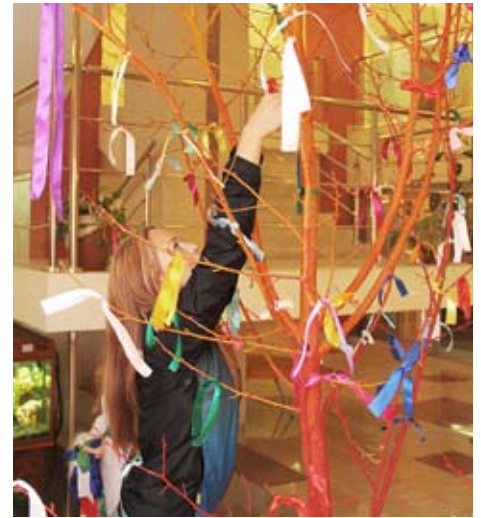
Чтобы не спугнуть удачу, гости загадывали самое сокровенное и повязывали ленточки на «дерево желаний»

«Удача сейчас очень пригодится», - соглашались конкурсанты. А чтобы ее не спугнуть, загадывали самое сокровенное и повязывали ленточки на «дерево желаний».