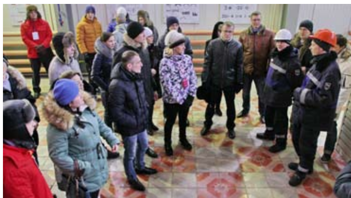
Ребята побывали на газокompрессорной станции «Ужгородская» и в информационно-выставочном центре «Газпром трансгаз Югорска»