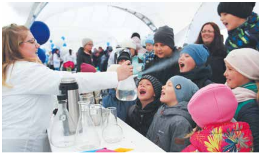
Юные гости фестиваля #ВместеЯрче участвовали в любопытных опытах

Общественная молодежная палата Югорска организовала мастер-класс по нетрадиционному применению отслуживших вещей и по созданию тематических арт-объектов и поделок. Например, детей научили, как из одноразовых тарелок делать фигурки динозавров и костюмы доисторических животных, а из пластиковых бутылок, кусков ткани и обрывков веревки – красочные браслеты. Молодежь также де-