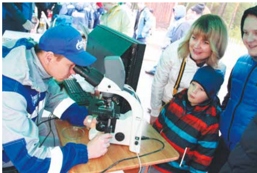
Знакомство с измерительными приборами