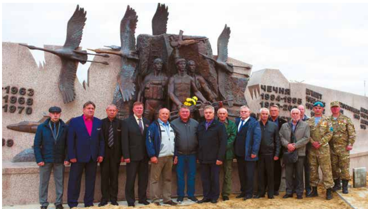
Ветераны локальных войн на встрече с писателями