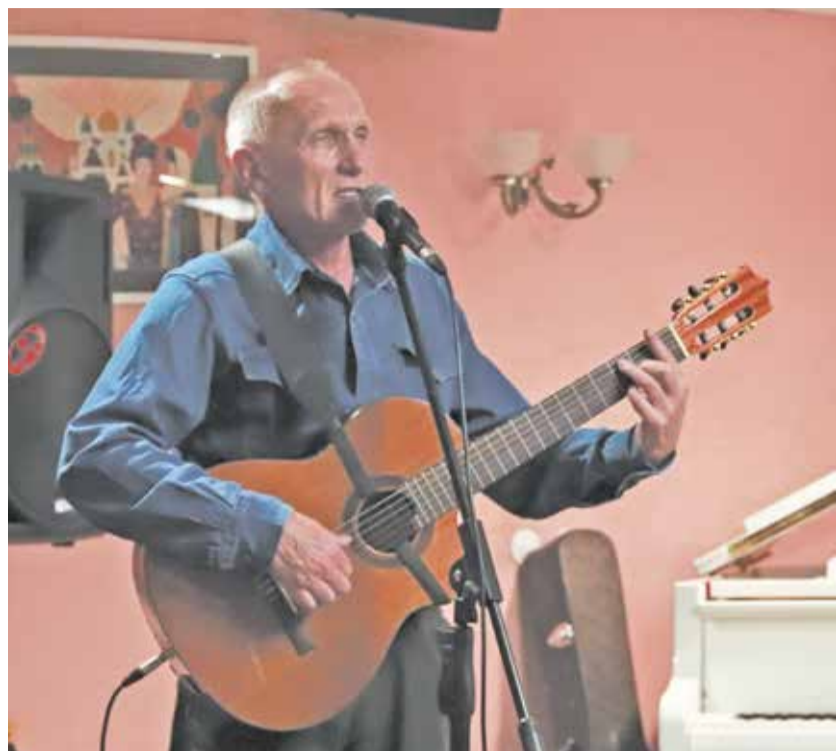
В литературном кафе