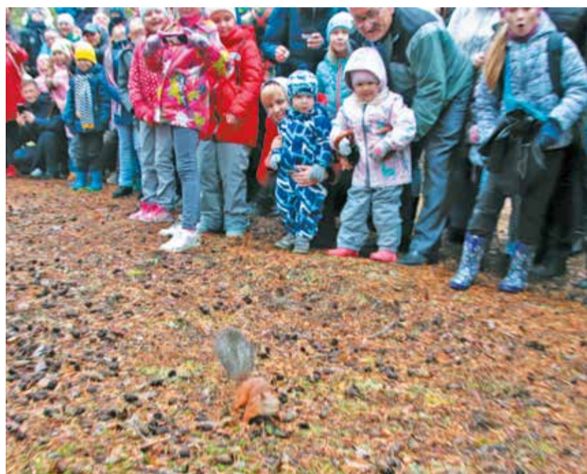
Новые жильцы «Белкиного дома»

Территория экопарка «Белкин дом», созданного работниками «Газпром трансгаз Югорск» на лыжной базе КСК «Норд» еще в 2014 году, продолжает преобразоваться. Накануне Дня газовика в парке были установлены еще 25 красивых прочных кормушек и 70 домиков-дуплянок для белок. Сейчас в парке их более 140 штук. Все сделаны в строгом соответствии с рекомендациями зоологов специалистами Управления эксплуатации зданий и сооружений.