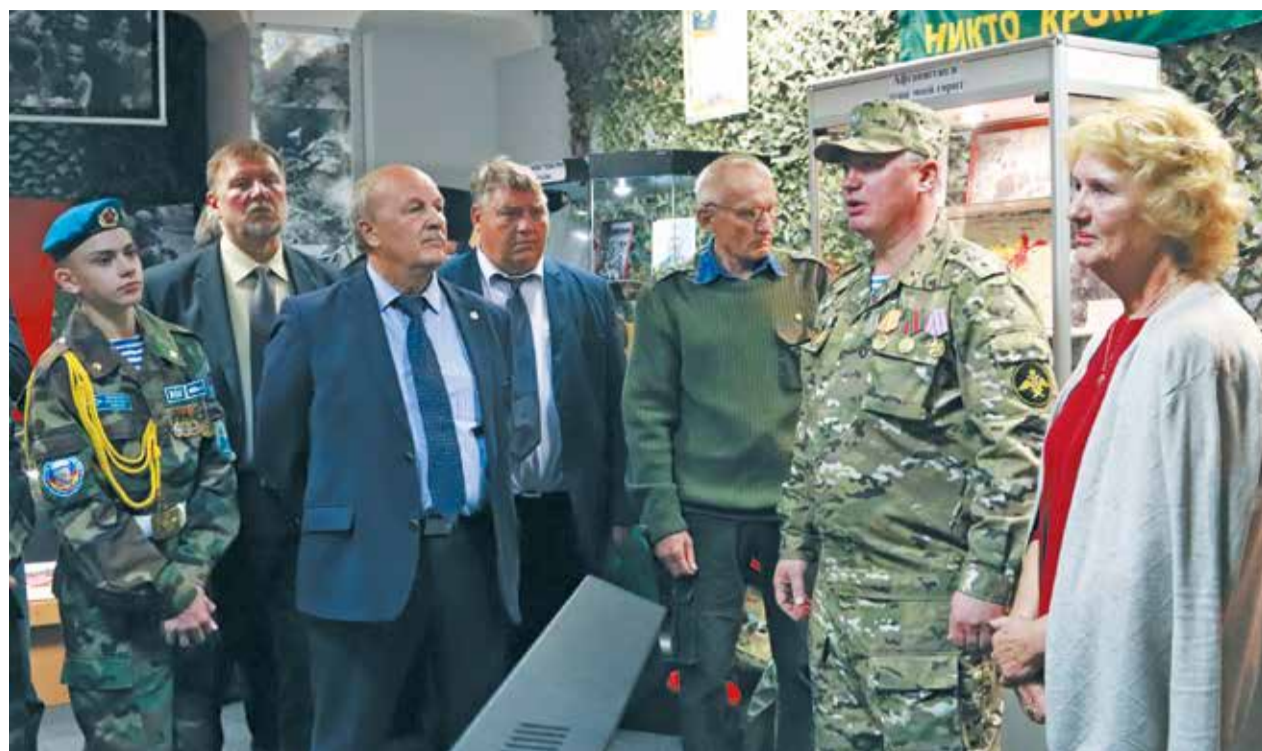
Встреча писателей с ветеранами армии в музее