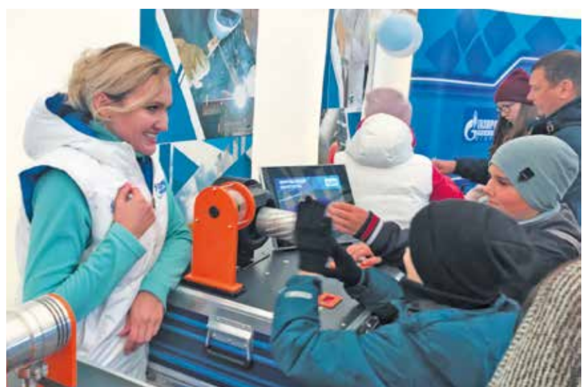
Мобильный вариант корпоративного музея «Газпром трансгаз Югорск»

Мероприятие проводится с 2016 года и включает в себя семейные праздники на центральных площадях и в парках областных и муниципальных центров. Акцент делается на мероприятиях для детей и молодежи.