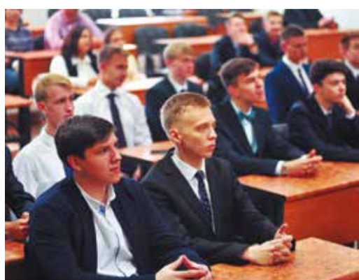
Студенты 1 курса кафедры «Энергетика» УрФУ в г. Югорске

Служба по связям с общественностью и СМИ