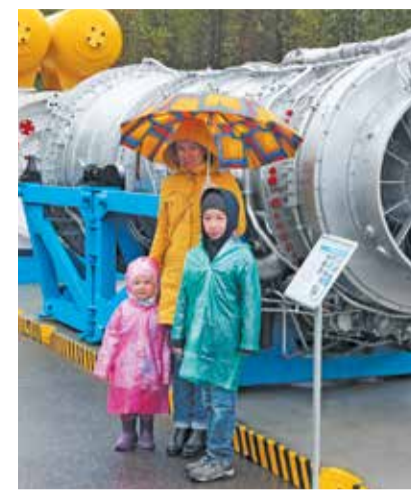
У газоперекачивающего агрегата

«Газовики не замыкаются в собственном мире, работают