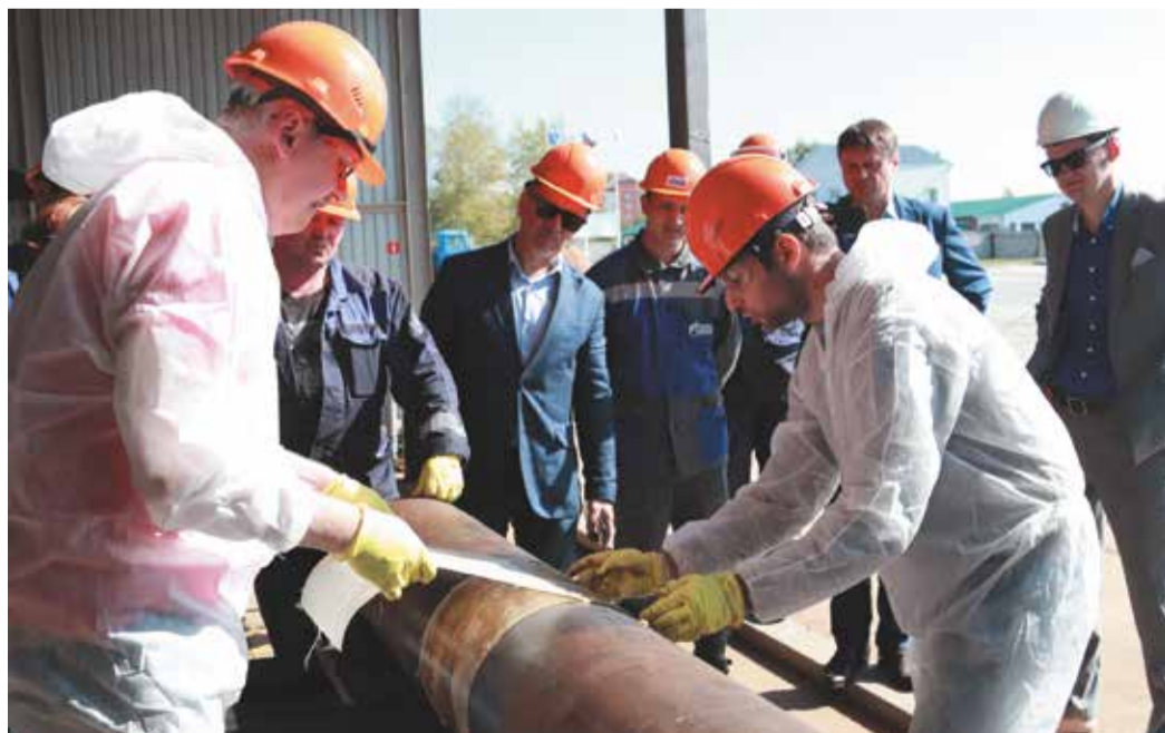
Применение композитной муфты

«Применены были три типа конструкции муфт, отличающихся армирующими элементами и материалами адгезивов, - поясняют эксперты «Газпром СтройТЭК Салават». – Демонстрация выполнялась на образцах труб Ду 300, Ду 500, Ду 1400, на поверхности которых нанесены были искусственные дефекты различного происхождения (вмятины, риски, питтинговая и общая коррозия, потеря металла, смещение кромок кольцевого шва).