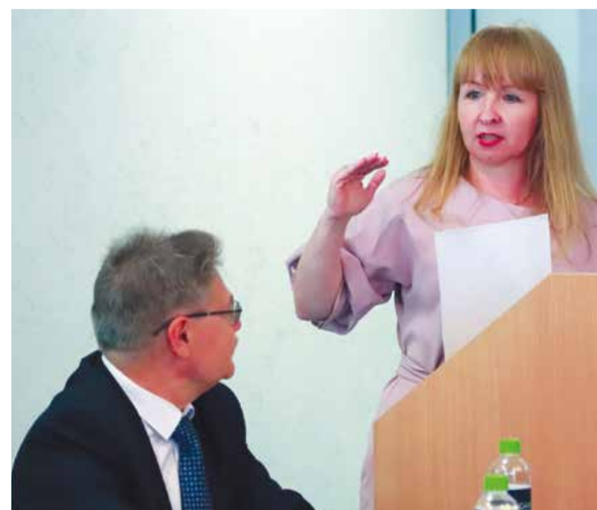
На литературном семинаре