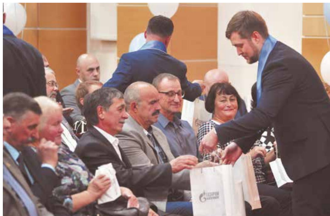
Вручение подарков ветеранам предприятия