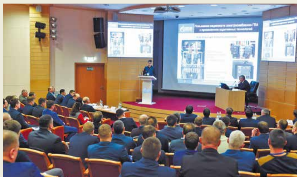
На заседании Совета молодых специалистов и новаторов производства

Подведены итоги конкурса среди дочерних обществ и организаций ПАО «Газпром» в области изобретательской и рационализаторской деятельности в 2018 году. В результате первое место в категории «Дочернее общество ПАО «Газпром», добившееся наилучших показателей в рационализаторской деятельности по итогам 2018 года» присуждено ООО «Газпром трансгаз Югорск».