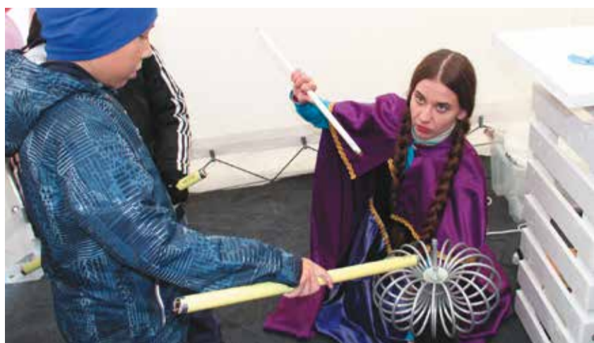
Дети с восторгом вызвали искусственную молнию в Тесла-шоу