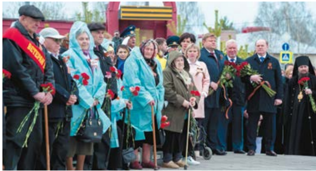
У мемориала Защитникам Отечества и первопроходцам земли Югорской собрались тысячи горожан