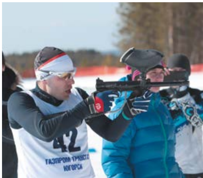
На рубеже спортсмены могли сделать только десять выстрелов

Лыжные гонки плюс пейнтбол – для Югорска сочетание необычное. «Красочный биатлон» – так называется новый вид соревнований, которые организовали активисты цеховой профсоюзной организации и молодежного комитета администрации Общества «Газпром трансгаз Югорск».