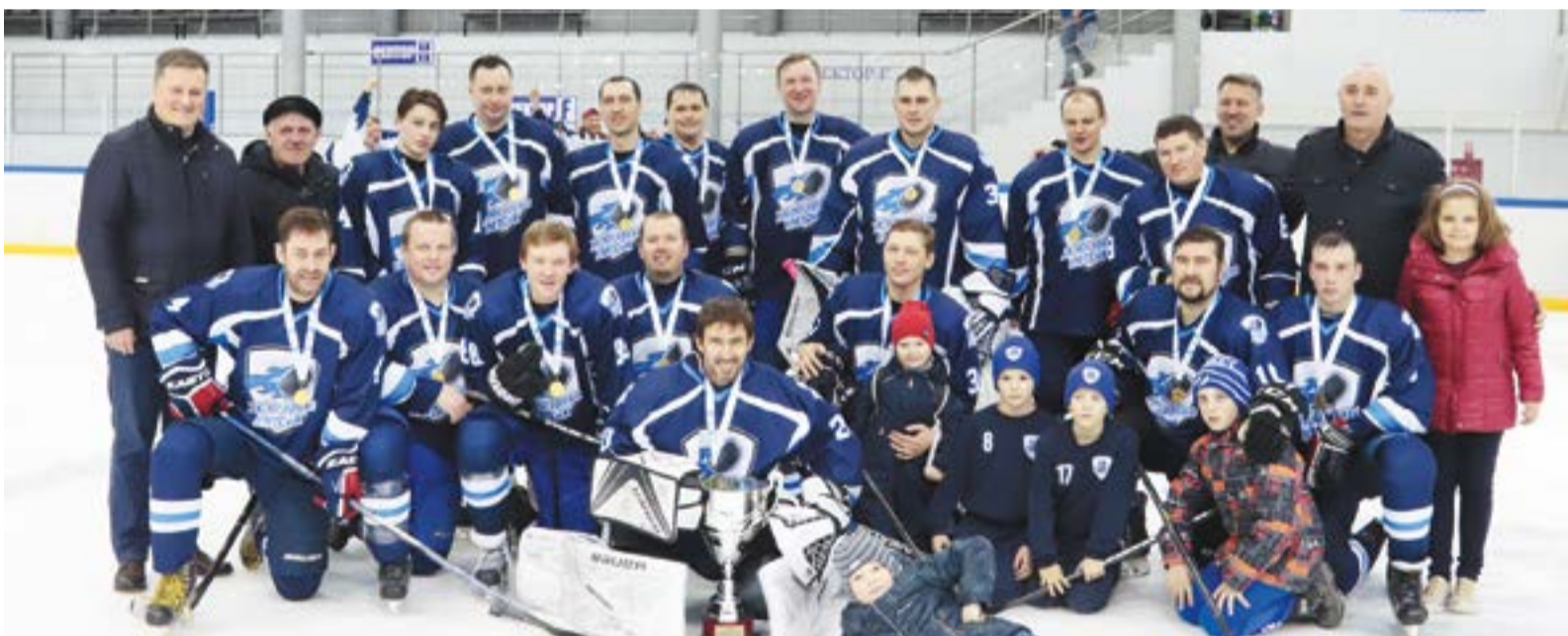
Хоккейный фестиваль – очень важное спортивное событие