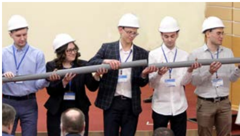
По трубам, соединенным в символический газопровод, участники слета запустили «газ»

карте региона присутствия ООО «Газпром трансгаз Югорск».