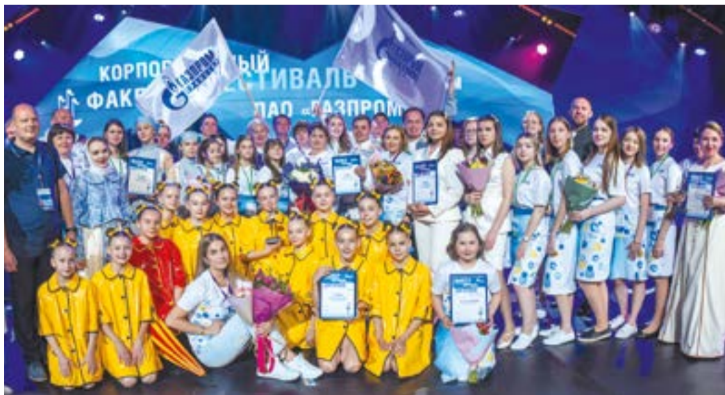
Артисты ООО «Газпром трансгаз Югорск» - победители корпоративного фестиваля «Факел»

15 мая в концертном зале «Роза Холл» (Красная Поляна, Сочи) состоялась церемония награждения лауреатов и призеров финального тура VIII корпоративного фестиваля ПАО «Газпром» «Факел».