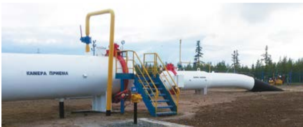
Камеры запуска-приема УП КЦ №3

Выполнен капремонт здания службы защиты от коррозии, произведены работы по утеплению здания и кровельного простран-