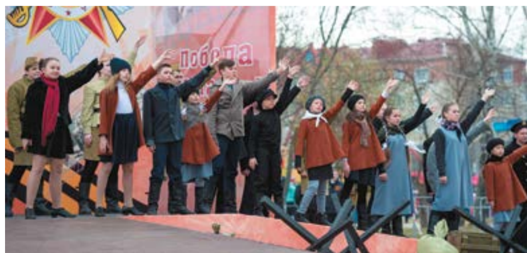
Кульминацией мероприятия стало широкомасштабное театральное представление о Великой Отечественной войне

Иван Цуприков