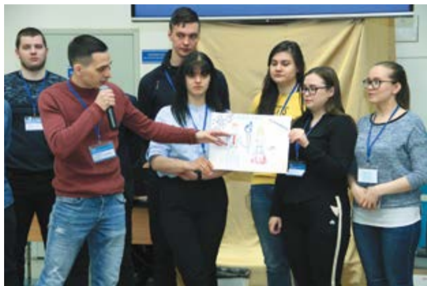
В ходе викторины, посвященной охране труда и промышленной безопасности, команды почерпнули много полезной информации

Завершением второго дня стал интеллектуальный квиз (от англ. quiz – «соревнование»), который для участников слета организовали