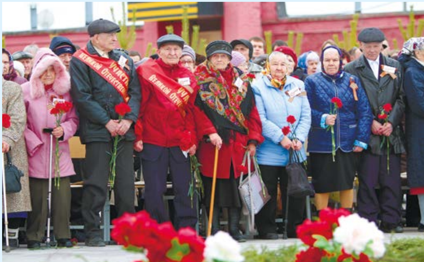
Ветераны Великой Отечественной войны, труженики тыла и дети войны