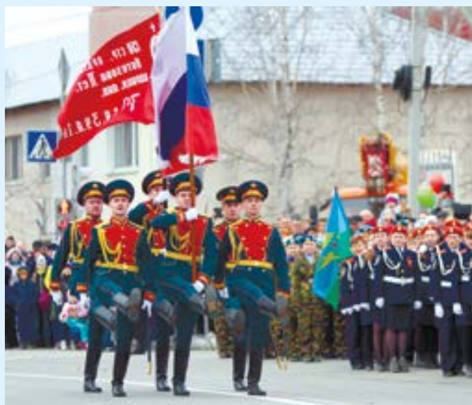
Рота почетного караула открывает парад