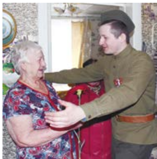
В гостях у ветерана

Одним из самых ярких и интересных проектов клуба «Вечный огонь» стал авторский спектакль «Война – Женщина», премьера которого состоялась в КСК Перегребненского ЛПУМГ 19 мая 2017 года.