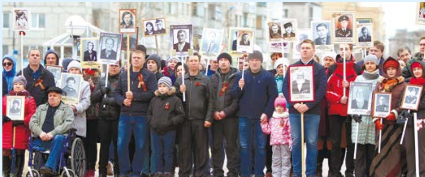
Участники шествия «Бессмертный полк»