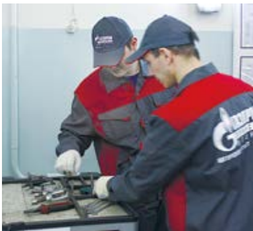
Первое испытание оказалось самым легким

Первое испытание называлось «Охрана труда» и проходило в обычной ремонтной мастерской, где испытуемым предстояло за ограниченное время выявить ряд несоответствий нормативным документам в области ОТ и ПБ. Среди них: самодельный инструмент, оборудование с истекшим сроком поверки, разлитое масло и так далее. Подобные несоответствия выявляются работниками управления при проведении административно-производственного контроля первого уровня, который осуществляется ими еже-