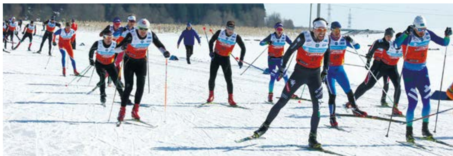
В «Югорском лыжном марафоне» участвовало более 1800 человек

34-м из 559. Правда, остался не совсем доволен, потому что на прошлом марафоне у него было 27-е место. «В этом году не получилось хорошо подготовиться: было очень много работы, плюс перед марафоном проболел две недели. В следующий раз надеюсь улучшить результат».