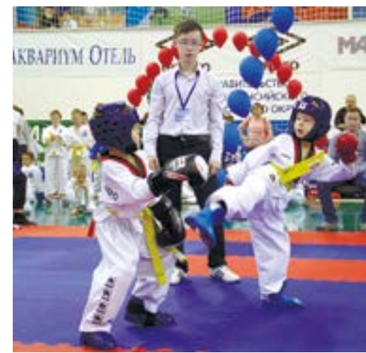
Более полутора сотен поединков уместилось в один состязательный день