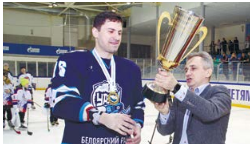
Обладателем Кубка Генерального директора ООО «Газпром трансгаз Югорск» стала сборная команда Белоярского региона