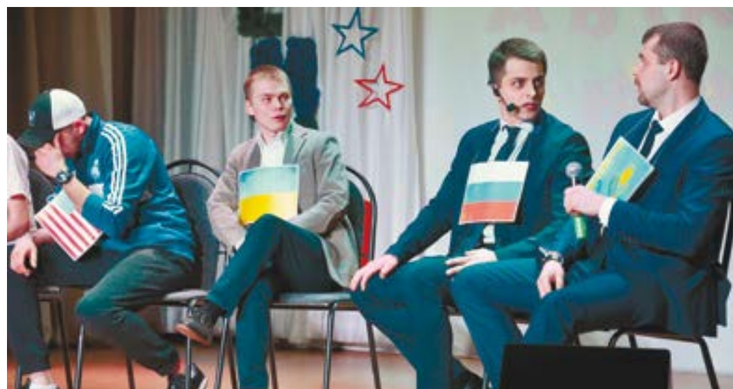
На тему выборов цутит команда «Дефекты»