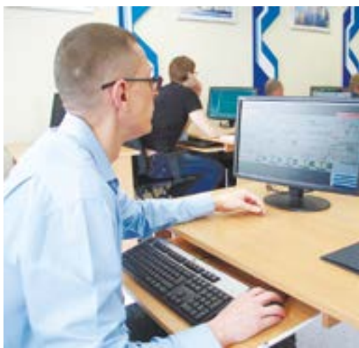
Участники конкурса профмастерства выполняют теоретические и практические задания

Практические навыки конкурсантов определялись во втором туре. Первое его задание состояло в локализации нештатной ситуации