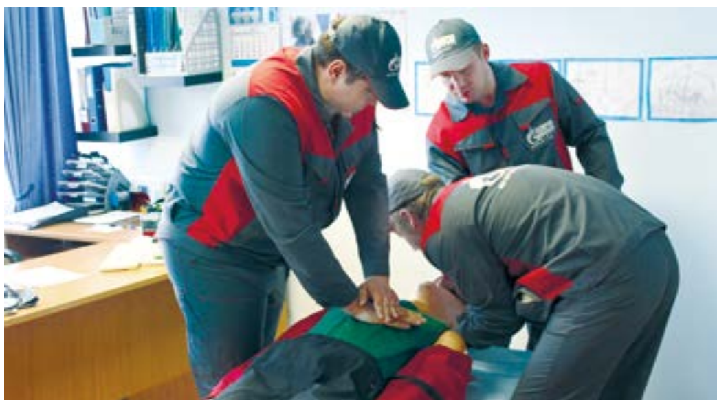
Одним из испытаний квеста стала реанимация манекена «Гоши»

дневно до, во время и после рабочей смены. Всего нарушений было десять, на их поиск каждой команде организаторы отвели десять минут.