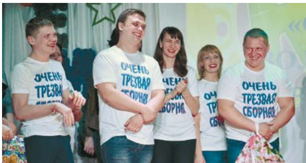
Победителем стала «Очень трезвая сборная»