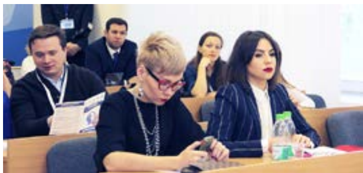
Участники секции «Корпоративная молодежная культура»

В ходе обсуждения работ с членами жюри стало ясно: интеллект-проекты актуальны для воплощения в любой компании, потому что они – «один из методов развития человеческого потенциала». Кроме того, как подчеркивают авторы югорского «Квиза», умным быть модно.